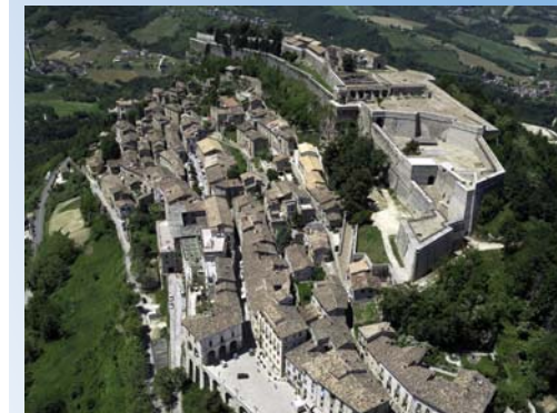
Fortezza di Civitella ed il suo museo

TUTTI I TRASFERIMENTI SONO GARANTITI DA PULLMAN DEDICATI