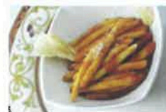
Ceppe di Civitella

Vogliamo tutti realizzare una bella festa Vi aspettiamo!